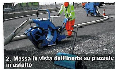
2. Messa in vista dell'inerte su piazzale in asfalto