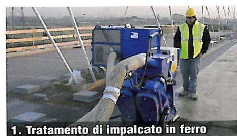
1. Trattamento di impalcato in ferro