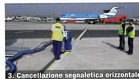
3. Cancellazione segnaletica orizzontale

Grazie a questi vantaggi la tecnologia si è sempre più affermata in ambito stradale ed aeroportuale anche per altre applicazioni in particolare per la rimozione di segnaletica orizzontale, per interventi di sgommatura di piste aeroportuali, per la preparazione di ponti, viadotti ed impalcato oltre che per trattamenti di pulizia da agenti contaminanti di pavimentazioni in granito, ciottolato, porfido estremamente diffuse nei nostri centri cittadini e che oggi sempre più di frequente sono mantenute e valorizzate. Oltre a interventi destinati a migliorare gli aspetti funzionali delle pavimentazioni si assiste sempre più spesso alla realizzazione di interventi "estetici". ■■